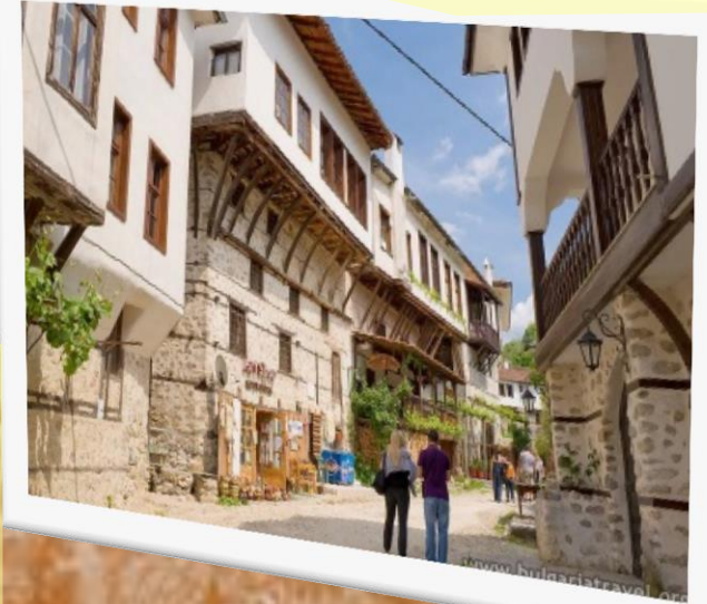
Die Straßen von Melnik

Eine faszinierende Reise mit gastronomischen und kulturellen Höhepunkten