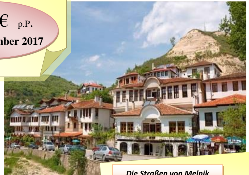
Die Straßen von Melnik