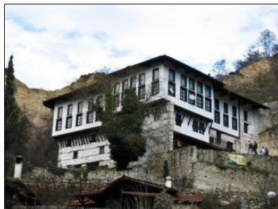
Melnik begrüßt mit seinem milden Klima und aromatischen

Nach dem Frühstück erwartet Sie das Rozhen Kloster. Dieses gehört zu den schönsten Klöstern des Landes und ist das Größte in der Umgebung des Pirin-