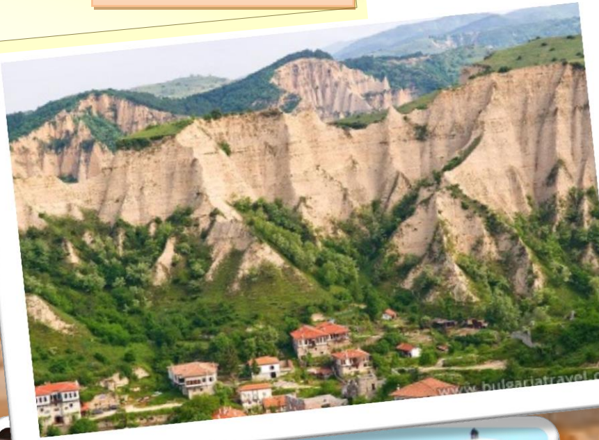
Die Pyramiden von Melnik